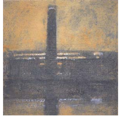
Tate Modern. 2013 Óleo sobre tabla 13'8 x 13'8 cm.