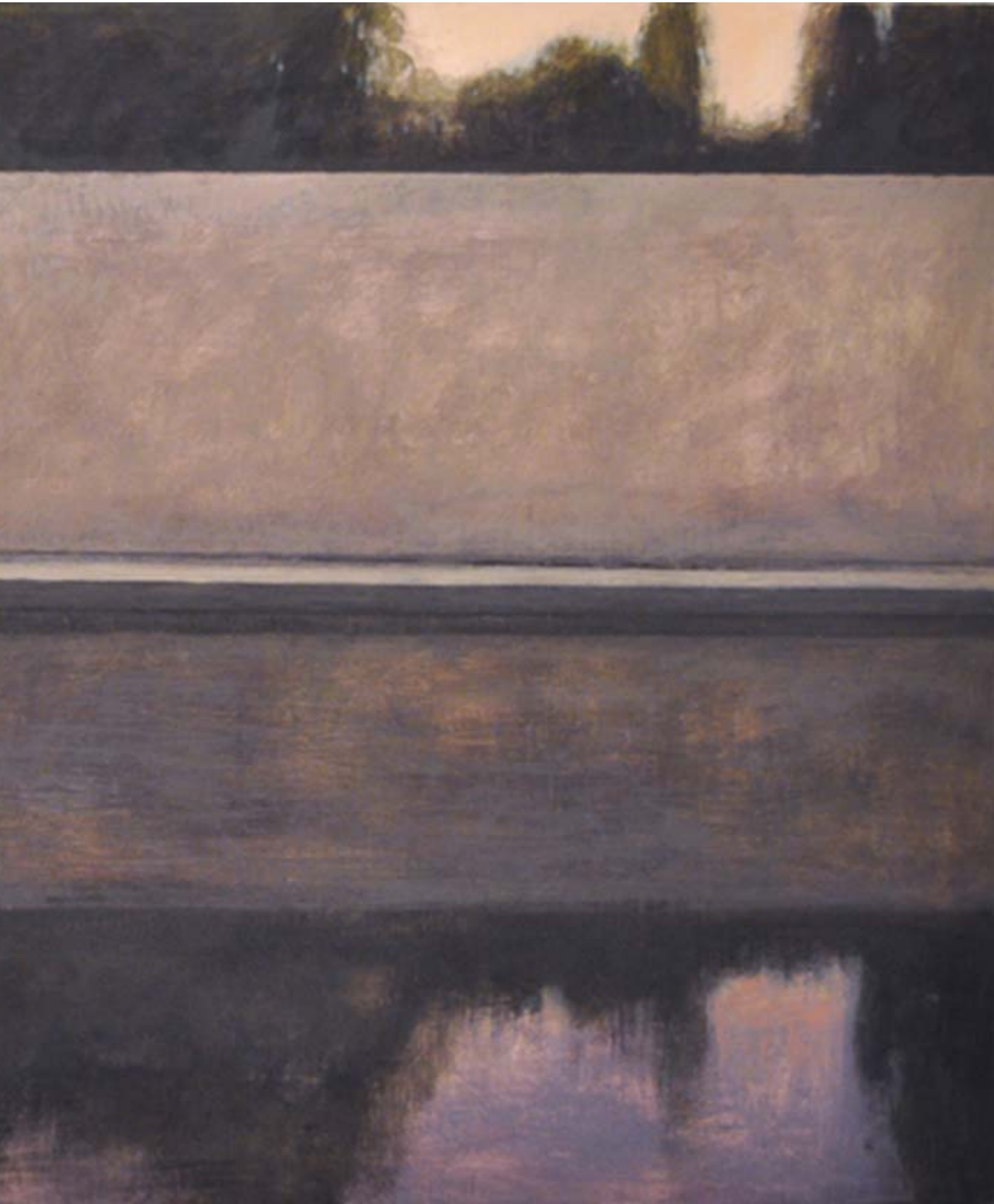
Barcelona Pavilion II. Mies Van der Rohe. 2013 Óleo sobre lienzo 120 x 200 cm.