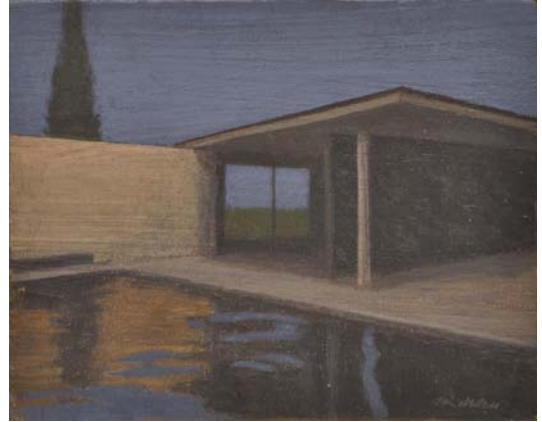
Barcelona Pavilion III. Mies Van der Rohe. 2013 Óleo sobre lienzo 19 x 24 cm.