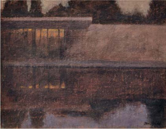
Barcelona Pavilion I. Mies Van der Rohe. 2013 Óleo sobre lienzo 19 x 24 cm.