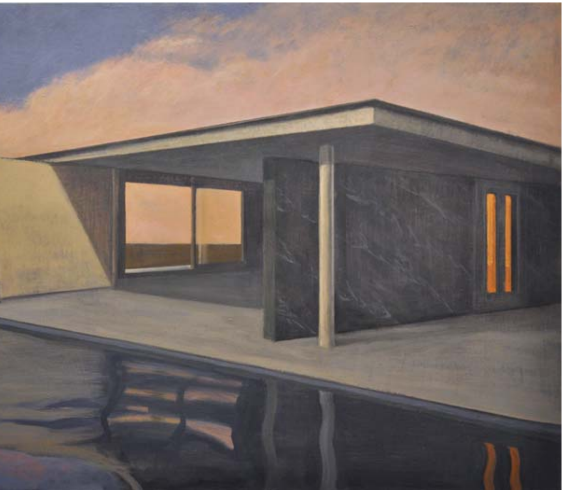
Barcelona Pavilion IV. Mies Van der Rohe. 2013 Óleo sobre tabla 100 x 150 cm.