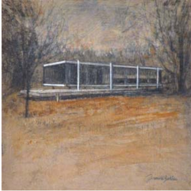
Farnsworth house-Autumn. Mies Van der Rohe. 2013 Óleo sobre tabla 13'8 x 13'8 cm.