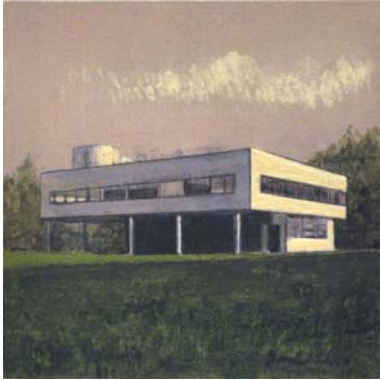
Villa Savoye. Le Corbusier. 2013 Óleo sobre tabla 13'8 x 13'8 cm.